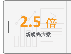
デジタルコンテンツがある場合とない場合の比較