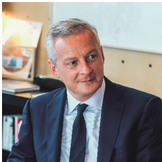
Bruno Le Maire, ministre de l'Économie, des Finances et de la Relance

La relance est l'occasion pour la France de se positionner à la pointe des technologies de rupture qui seront au cœur du monde de demain. L'hydrogène décarboné est l'une d'entre elles.