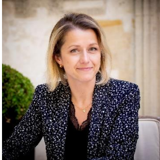
Barbara Pompili, ministre de la Transition écologique