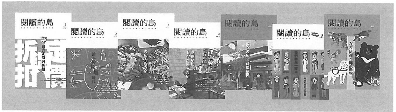
▲ 106-108 年友善書業合作社已發刊的七期《閱讀的島》書封