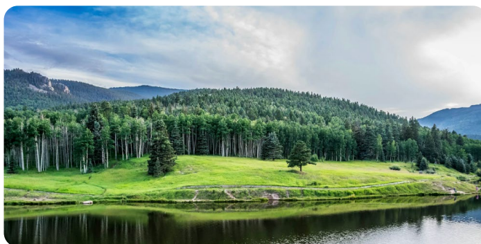
Capitale naturale e agroecologia