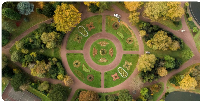
Economia circolare e riciclo