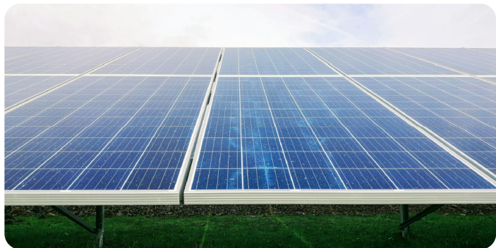
Energia e clima