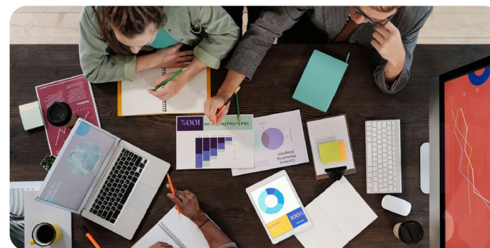
Strategie sostenibilità delle imprese