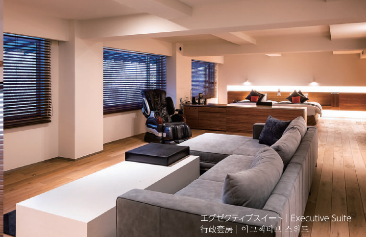
エグゼクティブスイート | Executive Suite 行政套房 | 이그제티브 스위트