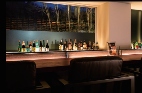
バー ZERO | Bar | 酒吧 | 바

上質な大人の夜と、本格的なバーメニューをお楽しみ いただける憩いの空間。(21:00~23:00)