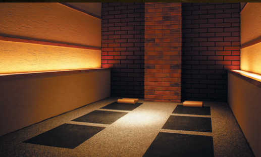
貸し切り岩盤風呂 | Bedrock Bath 岩盤浴包房 | 개별실 암반욕

Noboribetsu is nationally renowned for its hot springs, distinguished by their milky-white colour and simple hydrogen sulfide content. The free-flowing hot spring waters will soothe your body and soul.