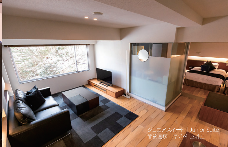
ジュニアスイート | Junior Suite 簡約套房 | 주니어 스위트