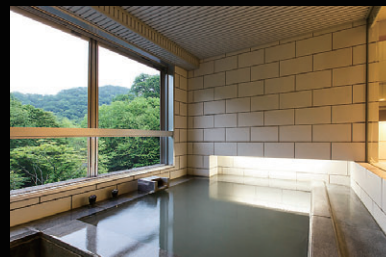
客室展望風呂 | Room Spa 客房附設觀景浴池 | 객실전용 전망온천