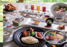
個室食事処 JIBIE | Private Restaurant 獨立包廂式餐廳 | 개별실 레스토랑