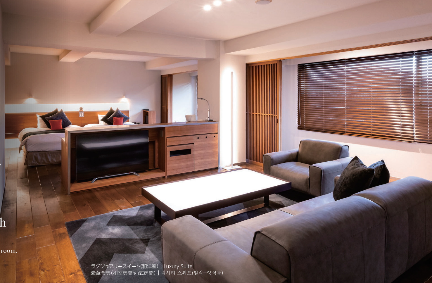
ラグジュアリースイート(和洋室) | Luxury Suite 豪華套房(和室房間・西式房間) | 럭셔리 스위트(일식+양식룸)