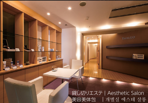
貸し切りエステ | Aesthetic Salon 美容美体包 | 개별실 에스테 살롱

リラクゼーションフロア COUPLES | Relaxation Floor 休憩区 | 릴랙세이션 플로어 男性・女性がおふたり一緒にご利用できる、個室タイプの貸し切り岩盤浴・ 貸し切りエステ。