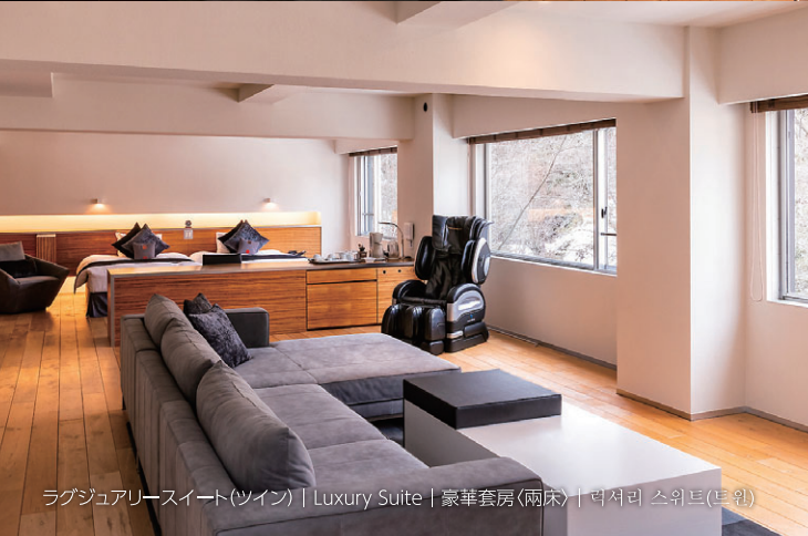
ラグジュアリースイート(ツイン) | Luxury Suite | 豪華套房(兩床) | 럭셔리 스위트(트윈)

The subtle design of our suites further brings out nature's own brilliant colors, a view best enjoyed from the private hot spring spa bath in every room. We invite you to enjoy the exceptional relaxation of a premium resort.