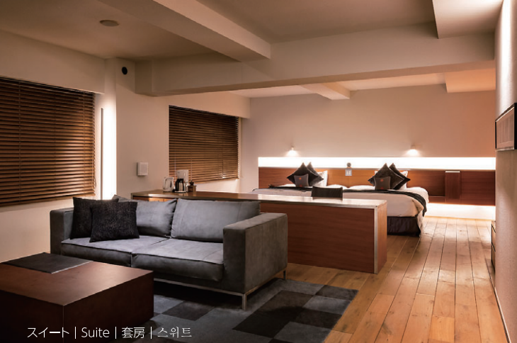
スイート | Suite | 套房 | 스위트