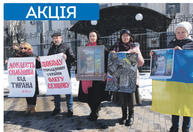
Учасники акції біля посольства РФ у Києві

Олег Сенцов є принциповим громадянином України, і це стало його найбільшою «провиною» перед