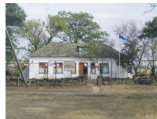
Дім у Краснодарці, збудований 1897 р.