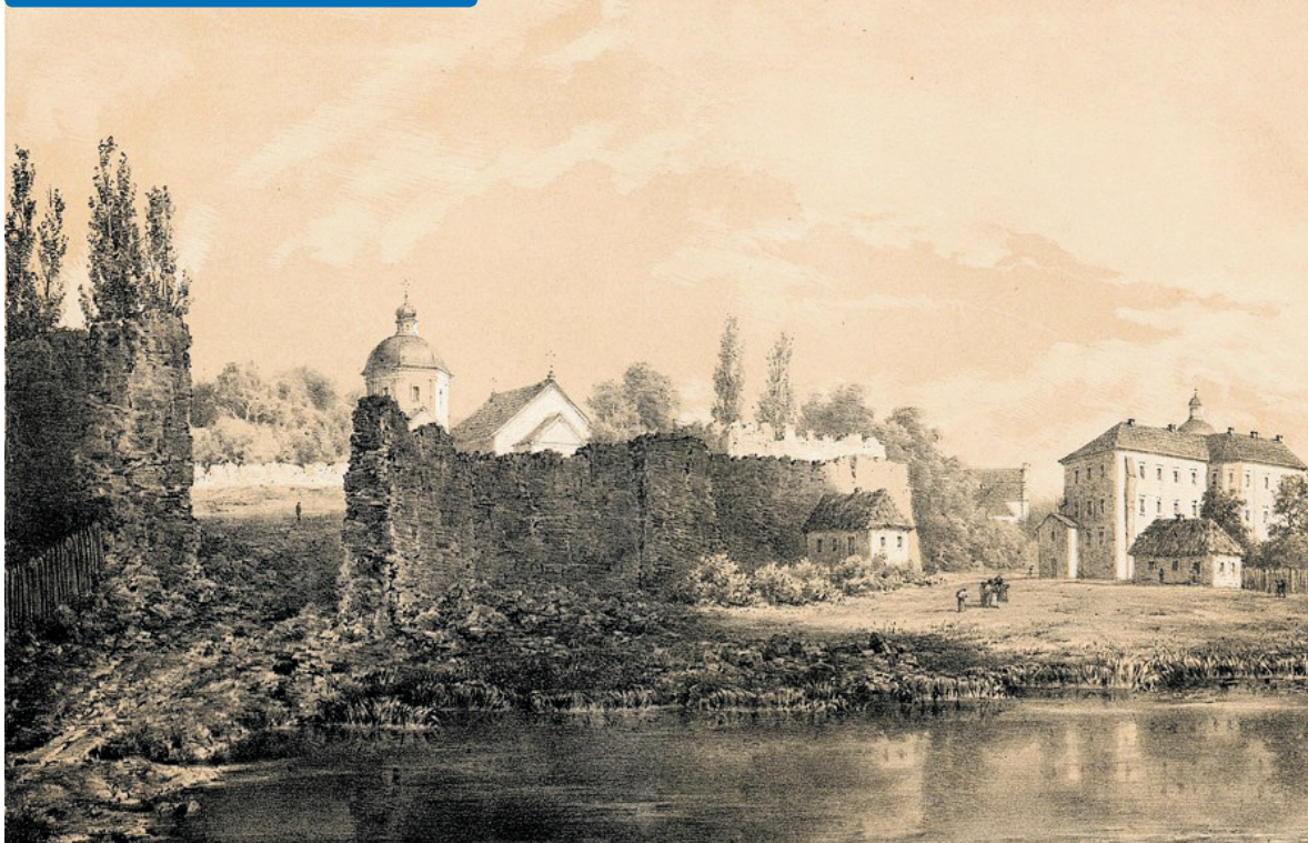
Картина білоруського художника Наполеона Орди «Бар», XIX ст.