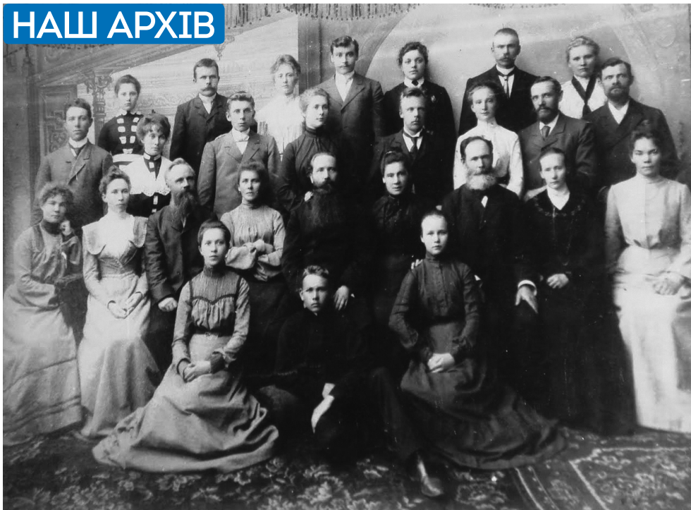
Сімферопольський естонський хор