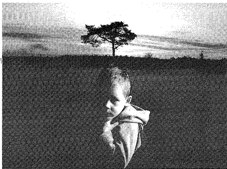
Medžiai auga iš žemės. Vaikai – iš mūsų. Mes esame jų Žemė.

Įprastinė vaikų ir jaunimo centro veikla – darbas su vaikais kasdien po pamokų. Tačiau moksleivių kasdieninio užimtumo problemų sprendimas laikas nuo laiko papildomas didesniais projektais, siekiant ne tik padėti mokyklai, šeimoms ir patiems vaikams, bet ir kaupti šioje srityje patirtį, ieškoti įvairesnių darbo formų, pagalbininkų. Kiekvienąsyk stengiamasi vertinti šių projektų praktinį efektyvumą. Tokia konkreiti „Vilties vėrinėlių“ priemonė buvo realizuota birželio mėnesį praėjusių vasaros atostogų metu. Savaitės trukmės dieninė stovykla socialiai remtinių šeimų vaikams suorganizuota gilinant jų pažinimo, saviraiškos bei bendravimo poreikius. Tėvams sutinkant trisdešimt panorusių da-