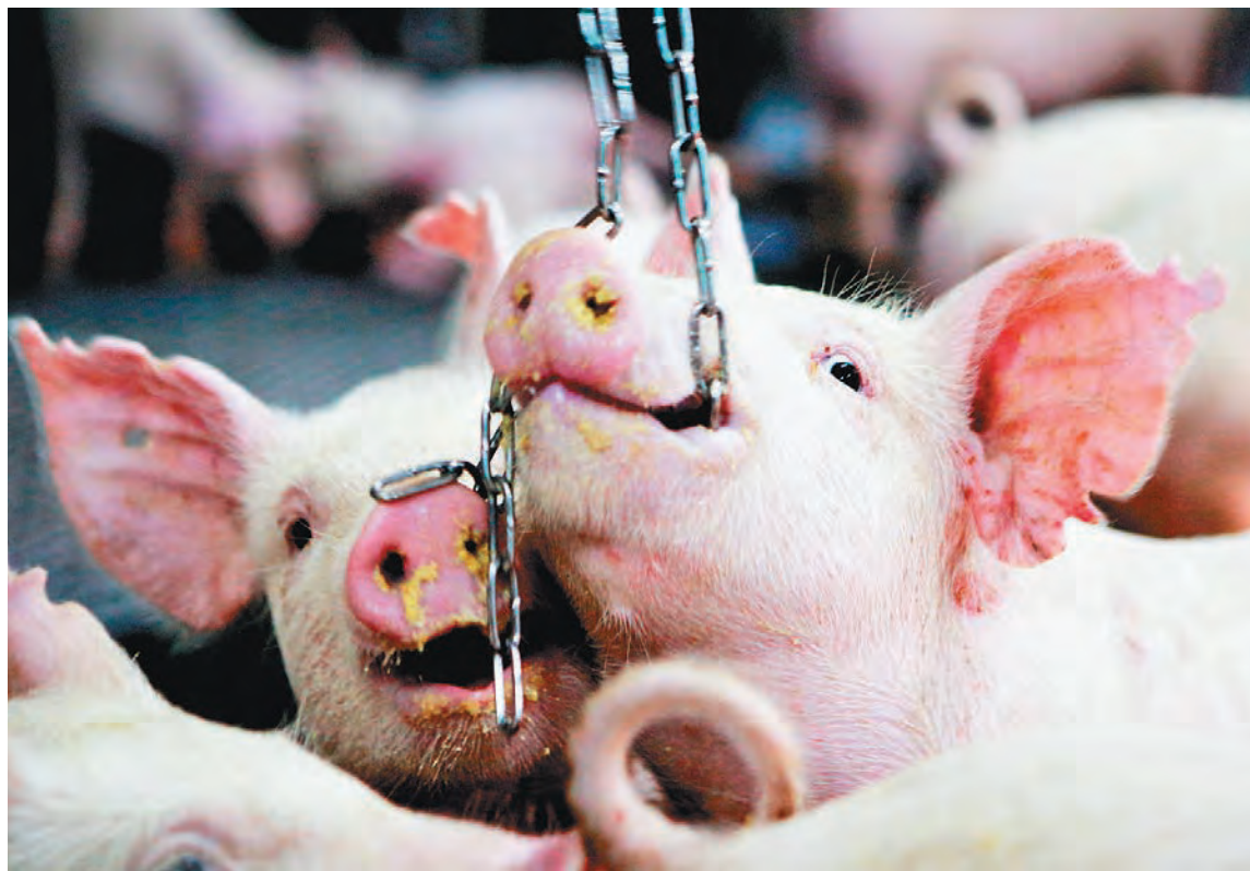
豬是好奇寶寶，喜歡探索，當環境太擁擠會打架，動福飼養設置鐵鏈分散牠們注意力。

美國學者梅樂妮·喬依指出，3周大的小豬就知道自己的名字，聽到名字也會回應；在自然環境下，懷孕母豬可能走6英里的路，找出生產的地點，再花10小時築窩。但絕大多數的豬，在被塞進卡車送去屠宰前，沒有見過戶外環境。小豬咬尾，是因為所有自然本能都受阻，變得神經質，咬斷彼此的尾巴，類似人類的「創傷後壓力症候群」。