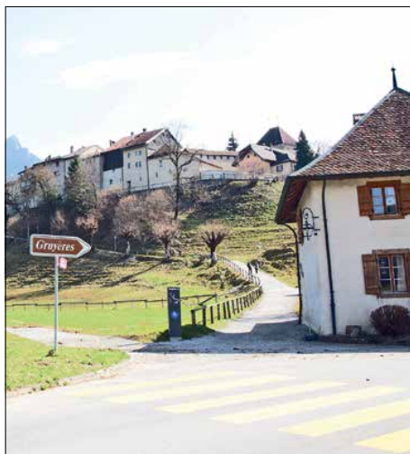
Dans la cité comtale, les futurs parkings devraient être en service en 2021 ou 2022.

Tractanda fourni, pour les citoyens de Gruyères. Ils ont tout accepté, avec plus ou moins d'enthousiasme: baisse d'impôt, adhésion au Parc naturel régional ou création d'une SA pour la gestion des futurs parkings.