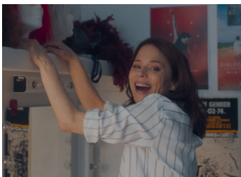
JEANNE Suzanne Clément