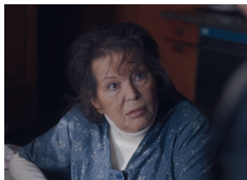
MARTHE Claudia CARDINALE

Dans BULLE il interprète Pascal, le mari d'Alice et père de Mathieu, un homme de nature solide et ambitieuse, fragilisé par l'annonce de la maladie de sa femme et les problèmes économiques de son entreprise.