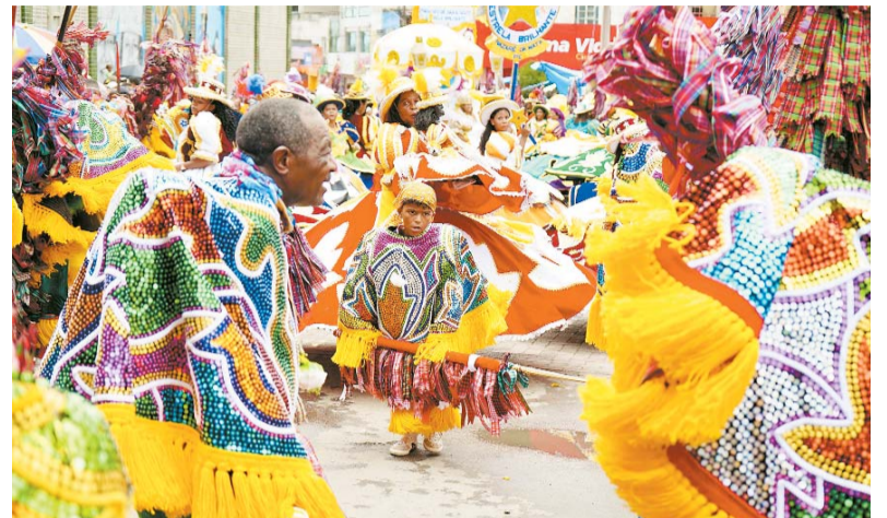
Manifestações populares e artistas locais foram protagonistas

centivo do governo o 28º Encontro de Maracatus de Baque Solto de Nazaré da Mata, o 36º Encontro de Bonecos Gigantes de Olinda; a Noite dos Tambores Silenciosos de Olinda, o 19º Carnaval Mesclado da Casa da Rabeca do Brasil, Boi da Ma-