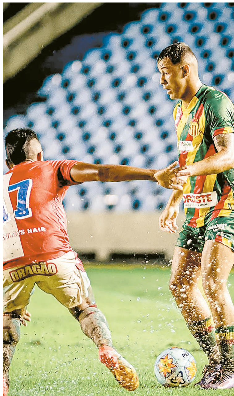
Times tiveram que encarar um gramado encharcado