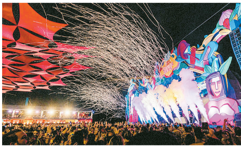
Festival recebe, anualmente, cerca de dez mil pessoas por dia em Olinda

sinada pela Senocarva, empresa do próprio grupo Carvalheira. “Ela nasceu para atender nossa demanda e hoje presta serviços para grandes eventos”, detalha.