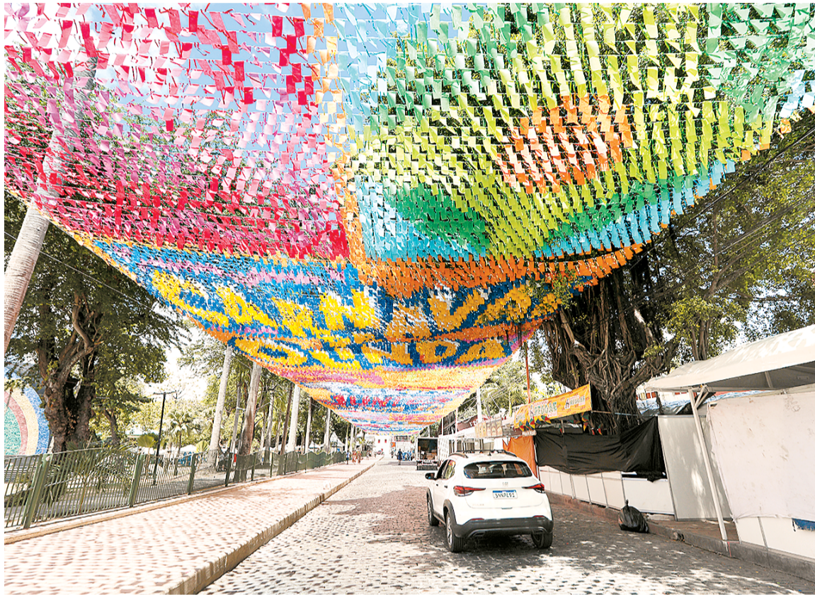
Foram montados 29 pontos de bloqueio fixos em Olinda, com vias fechadas com manilhas de concreto