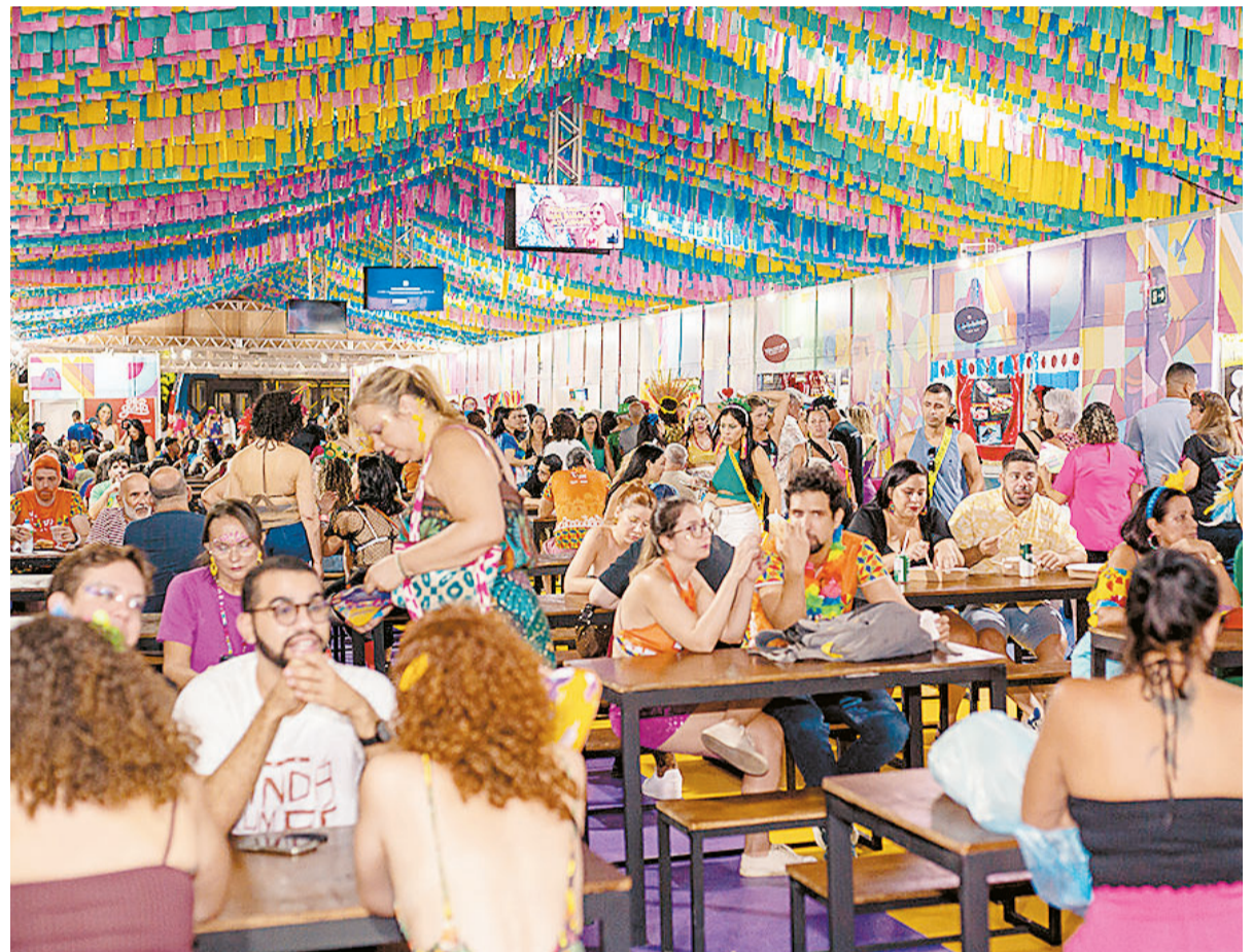
Central do Carnaval conta com Arena Gastronômica, que terá 13 restaurantes

A Central do Artesanato, que tem decoração inspirada nas ilustrações oficiais do Carnaval do Recife 2025, reunirá 35 boxes com produtos artesanais e serviços como customização de fantasias e massagem express. O espaço ainda contará com salão de beleza, sala do empreendedor, serviços da Secretaria de Política Urbana e Licenciamento, mídias digitais da Secretaria de Turismo e Lazer e atendimento da Secretaria Executiva da Política de Drogas.