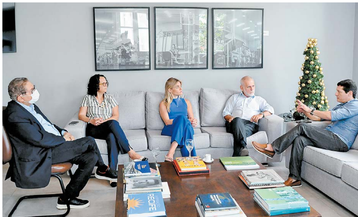
Defensor Público-Geral de Pernambuco realizou visita à Folha de Pernambuco ontem (26)