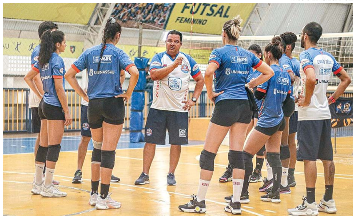
Equipe se prepara no local do confronto para se familiarizar com a estrutura do ginásio

O técnico Adalberto Nóbrega quer aproveitar os trabalhos de hoje e amanhã para que as atletas que chegaram nesta temporada possam conhecer melhor o local da partida. "O Geraldão é conhecido por