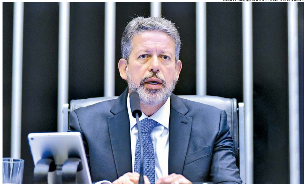
Em entrevista à TV Câmara, Lira falou sobre os 35 anos da Constituição de 1988 e também outros temas

Durante a entrevista, Lira tratou ainda sobre os ataques de 8 de janeiro, considerados por ele como atos "isolados" e afirmou que, naquele momento, "a Câmara se portou como garantidora da nossa democracia". Ele destacou, porém, a necessidade de punição a quem "atacou a democracia", a reação de união dos Poderes para defender as