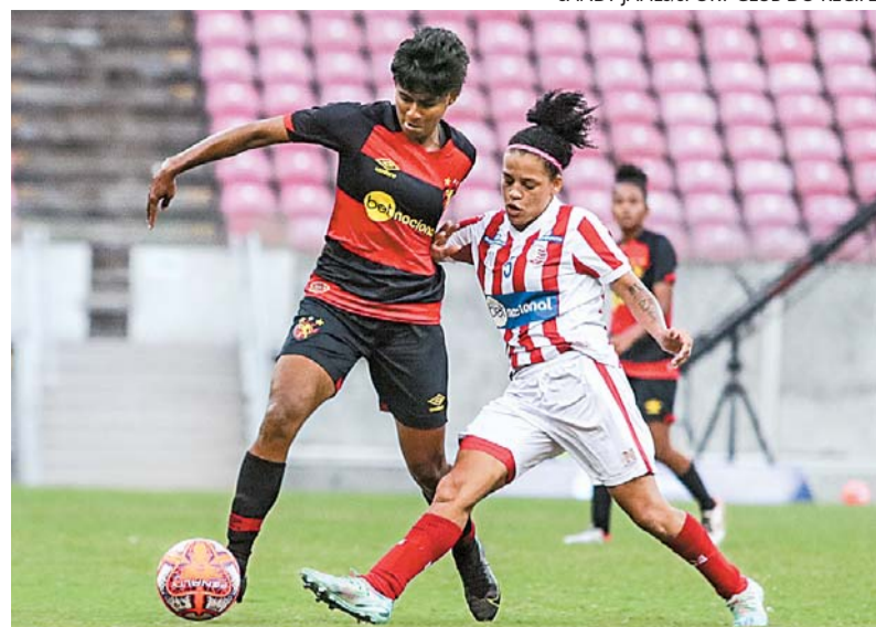
Norma busca incentivar a formação de equipes em Pernambuco

Sancionada pelo presidente da Assembleia Legislativa de Pernambuco (Alepe), Álvaro Porto, a lei entrou em vigor na última terça-feira, após publicação do Diá-