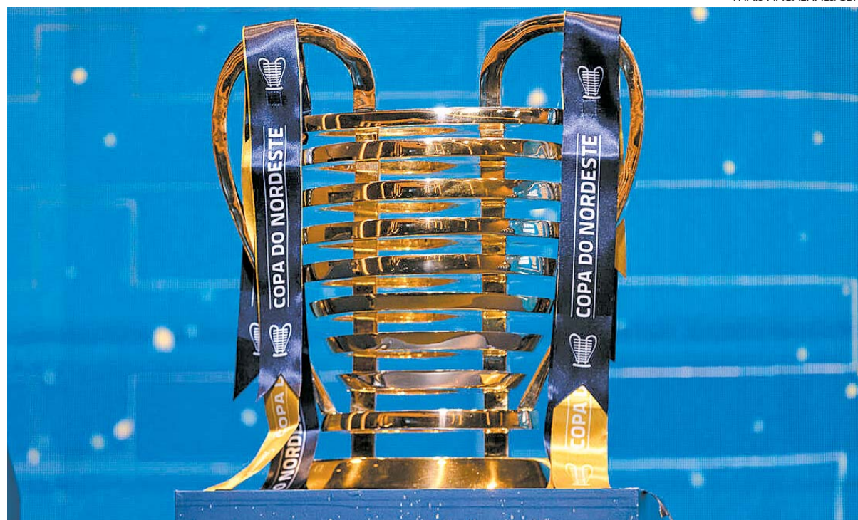
Copa do Nordeste começa dia 4 de fevereiro e tem previsão de encerrar em 9 de junho. Ceará é o atual campeão

Na primeira fase, os clubes do Grupo A enfrentarão os do Grupo B em turno único. Após o término da etapa estarão classificados para a mata-mata os quatro primeiros colocados de cada um dos dois blocos.