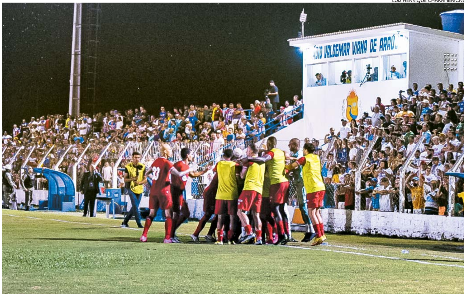
Náutico bate Afogados, no estádio Vianão, e chega à segunda vitória no Campeonato Pernambucano. Próximo jogo será contra Maguary

O Náutico passou os primeiros 45 minutos arriscando pouco de