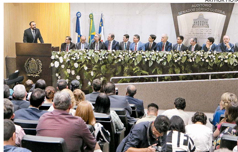
Em discurso, procurador reafirmou os compromissos de sua gestão