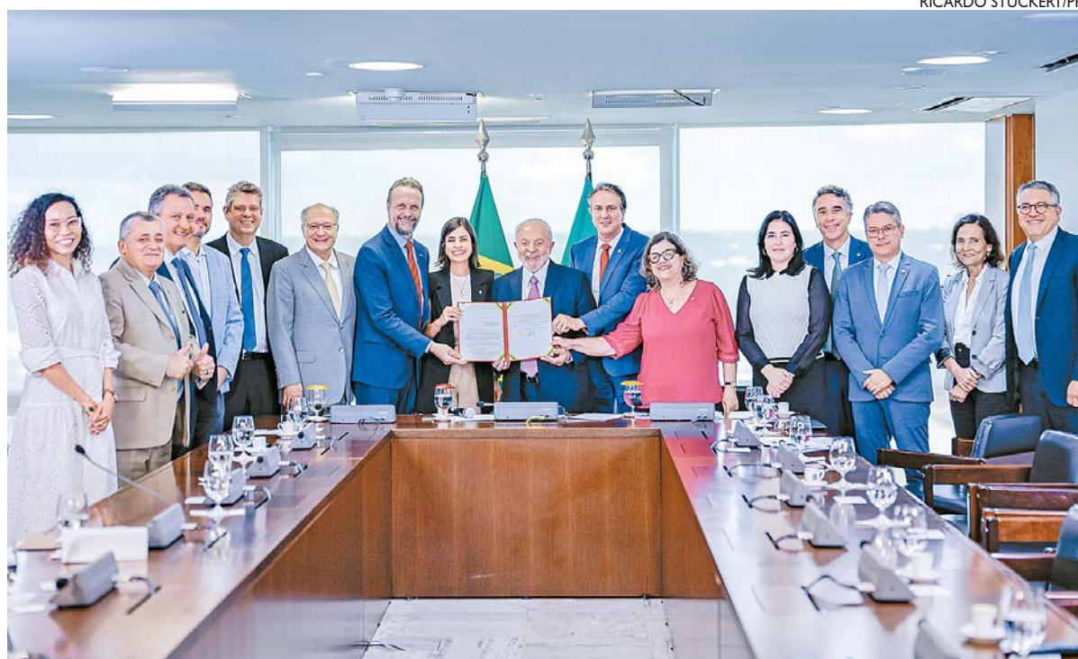
Ato de sanção da nova lei reuniu ministros e parlamentares. Serão investidos R$ 20 bilhões até 2026

Ao todo, devem ser investidos no projeto cerca de R$ 20 bilhões até 2026, sendo R$ 6 bilhões no próximo ano e R$ 7 bilhões para manutenção anual da política. O texto prevê beneficiar quase 2,5 milhões de jovens cadastrados no Bolsa Família, sendo 2,4 milhões do Ensino Médio e 170 mil entre 19 e 24 anos do EJA (Educação de Jovens e Adultos). Os estudantes terão que manter uma frequência mínima de 80% nas aulas para manter o direito de receber o auxílio.