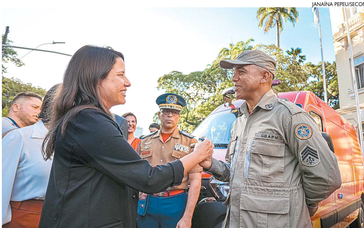
Em ato de entrega de viaturas, gestora estadual enfatizou os anúncios que serão feitos pelo Governo Federal

Em entrevista, após a entrega de viaturas de auto resgate para o Corpo de Bombeiros Militar de Pernambuco (CBMPE), ontem, Raquel Lyra enfatizou os anúncios que serão feitos pelo chefe do Executivo federal para o Estado, como investimentos na Refinaria Abreu e Lima e Escola de Sargentos. "Mais do que nos visitar, vem anunciar boas entregas. Entre quinta e sexta-feira a gente vai estar lá na refinaria Abreu e Lima", afirmou. "A gente ainda vai estar com ele (Lula) em uma visita à troca de comandos do Exército brasileiro, aqui, em Pernambuco, e será anunciado lá um investimento da Escola de Sargentos do nosso Estado", completou.