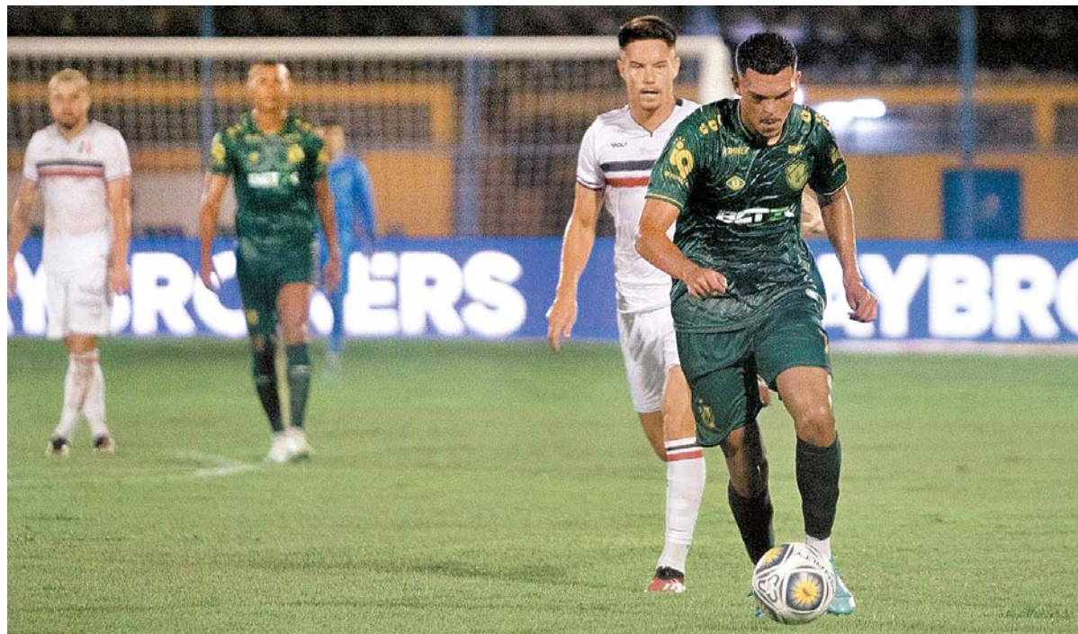
Longe do Nordeste, Cobra Cobral agora só tem garantido o Campeonato Pernambucano