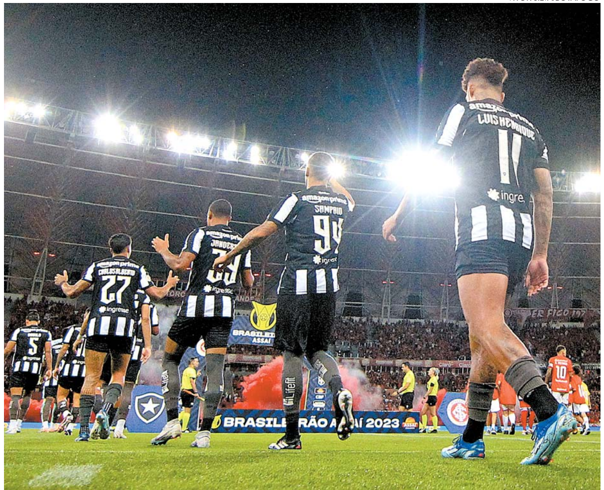
Após primeiro turno avassalador, Botafogo protagonizou derrocada inimaginável no Campeonato Brasileiro