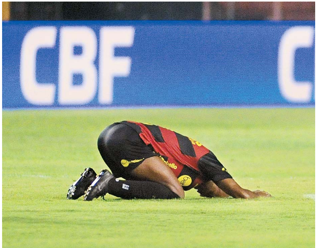
Time que mais ocupou G4 da Série B, Sport perdeu fôlego e, pelo terceiro ano seguido, ficará de fora da elite

COMANDO DA AERONÁUTICA GRUPAMENTO DE APOIO DE RECIFE