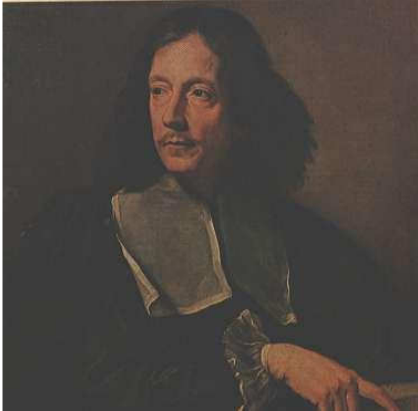
5. Carlo Maratti, Bildnis von Giovan Pietro Bellori, ehm. Besitz von Thomas Patch (Florenz); jetzt Rom. Detail.