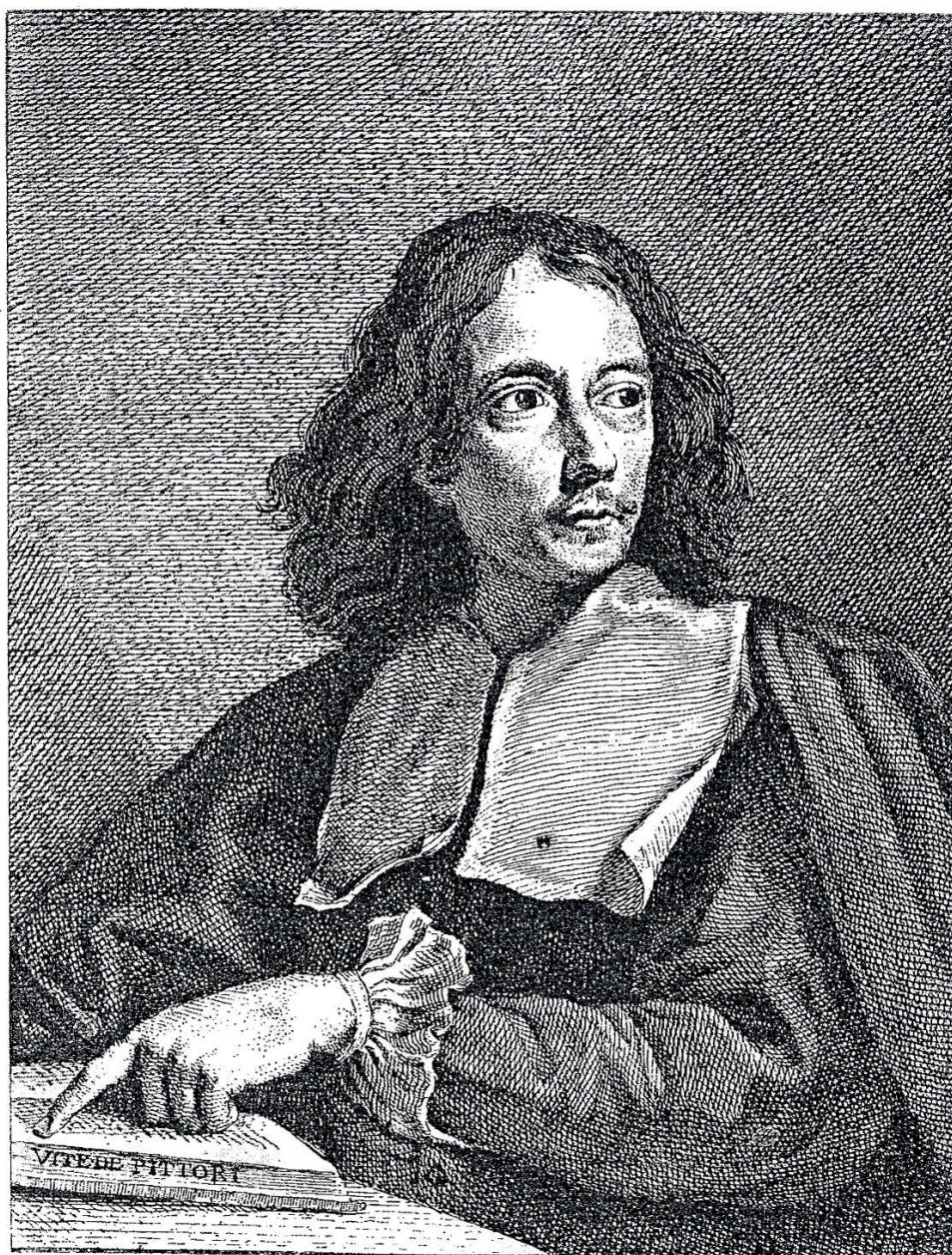
Il Ritratto di Gio. Pietro Bellori Autore delle Vite de' Pittori Dipinto da Carlo Maratti, e fatto a acqua forte, dal Quadro Originale, appresso Tommaso Patch Pittore Inglese.

“Il Ritratto di Giovan Pietro Bellori, Autore delle Vite de’ Pittori. Dipinto da Carlo Maratti, e fatto a acqua forte, dal Quadro Originale, appresso Tommaso Patch Pittore Inglese.”