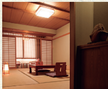
和室 ゆったりと流れる寛ぎの時間