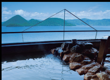
空中露天風呂(御影石造り)