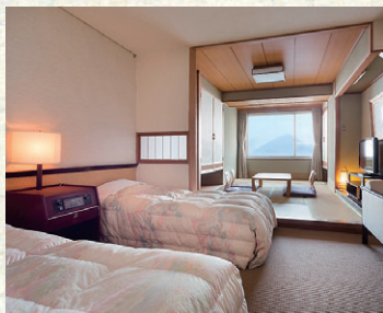
和洋室 満ちているのはやすらぎと落ち着き