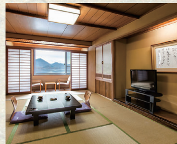
和室 旅の心を癒す、和のしつらえ