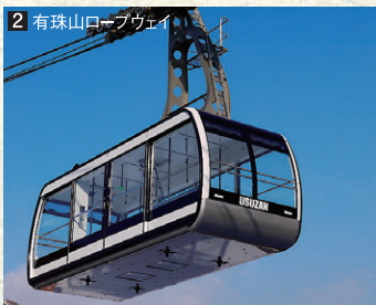
2 有珠山ロープウェイ

「人と彫刻がふれあふ自然公園」として、洞爺湖を囲むように58基の彫刻作品が配置されています。湖畔を歩きながら、あたりの自然とさまざまな彫刻家たちの作品群のコラボレーションを楽しめます。