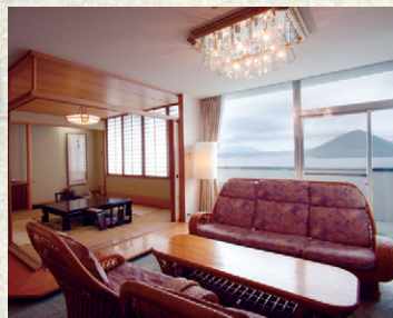
特別室 心を解き放つ、広びろとした特別室

時の流れと共に 豊かにうつろう湖の表情を 寛ぎに満ちた空間で ゆったりと、心ゆくまで。