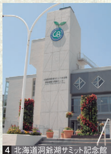
4 北海道洞爺湖サミット記念館