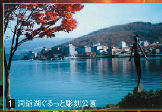
1 洞爺湖ぐるっと彫刻公園