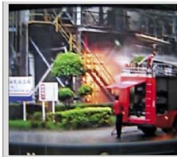
中油大林廠脫硫工場大火猛烈，警消搶救。