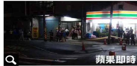
鳳林路現場呈現緩慢下陷。