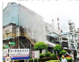
中油大林廠第一重油脫硫工場昨氣爆，警消動員搶救。