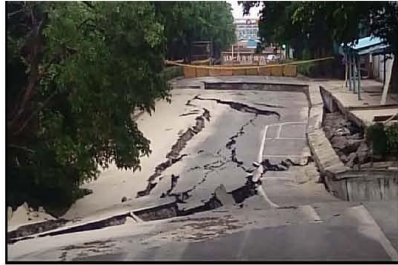
中油大林廠也淪陷