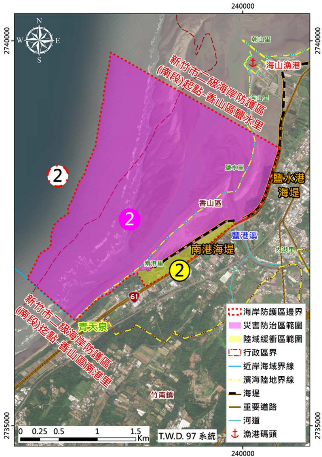
圖 1 新竹市二級海岸防護區及其災害防治區與陸域緩衝區範圍分區位置圖(頭前溪口至客雅溪口)北段