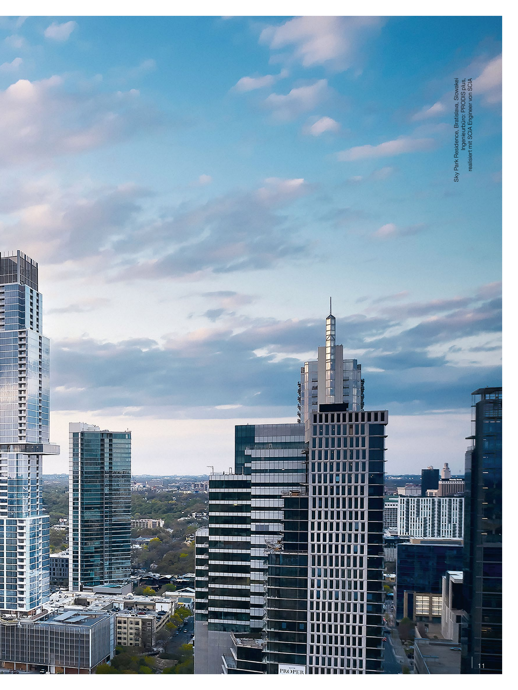
Sky Park Residence, Bratislava, Slowakei Ingenieurbüro: PRODIS plus, realisiert mit SCIA Engineer von SCIA