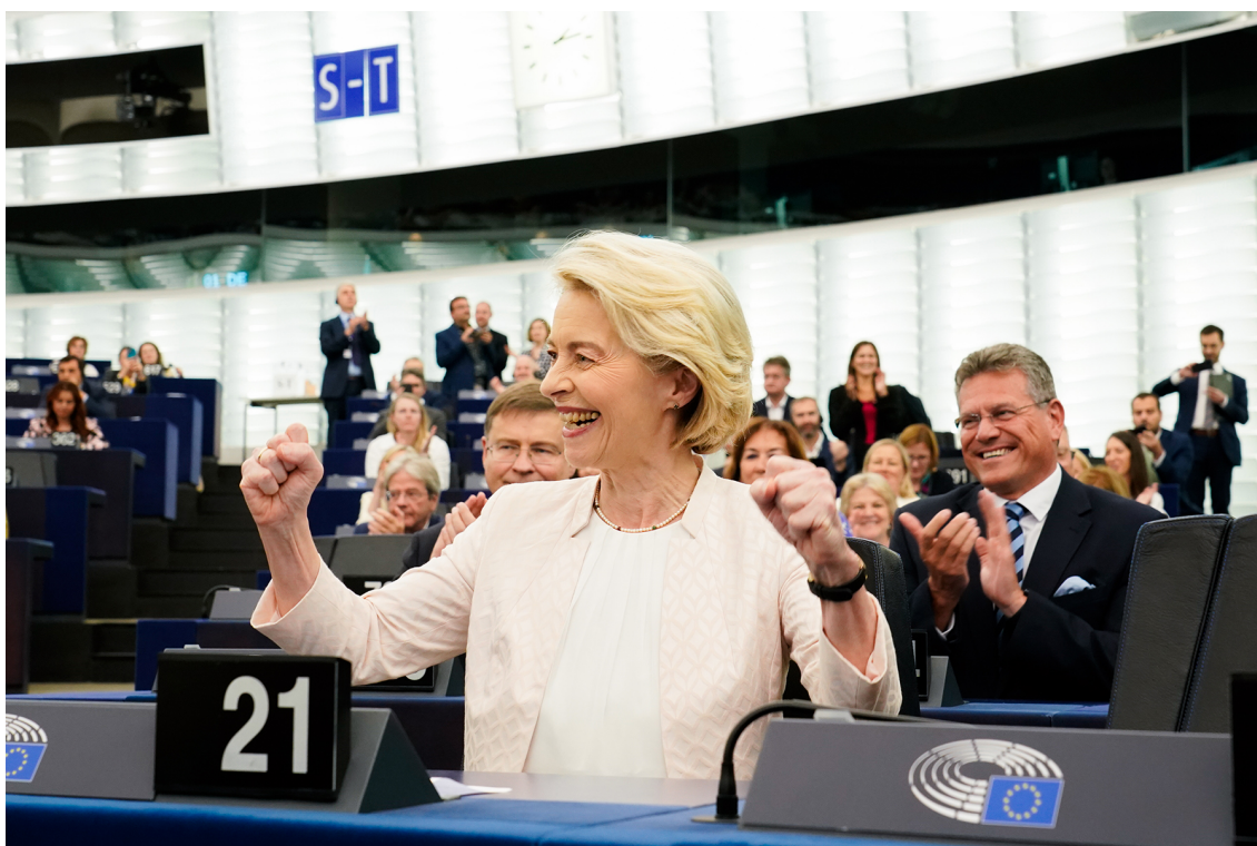
Ursula von der Leyen ser tmexxi l-Kummissjoni għal hames snin oħra

B'401 vot favur, il-Parlament Ewropew eleġġa lil Ursula von der Leyen bħala President tal-Kummissjoni Ewropea f'vot sigriet fit-18 ta' Lulju.