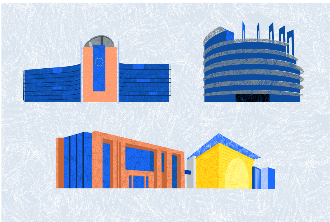
De gebouwen van de voornaamste EU-instellingen