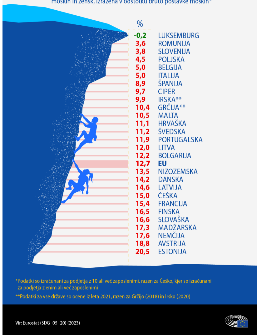
Razlike v plačah med spoloma v EU

Razlika med povprečnimi bruto urnimi postavkami zaposlenih moških in žensk, izražena v odstotku bruto postavke moških*