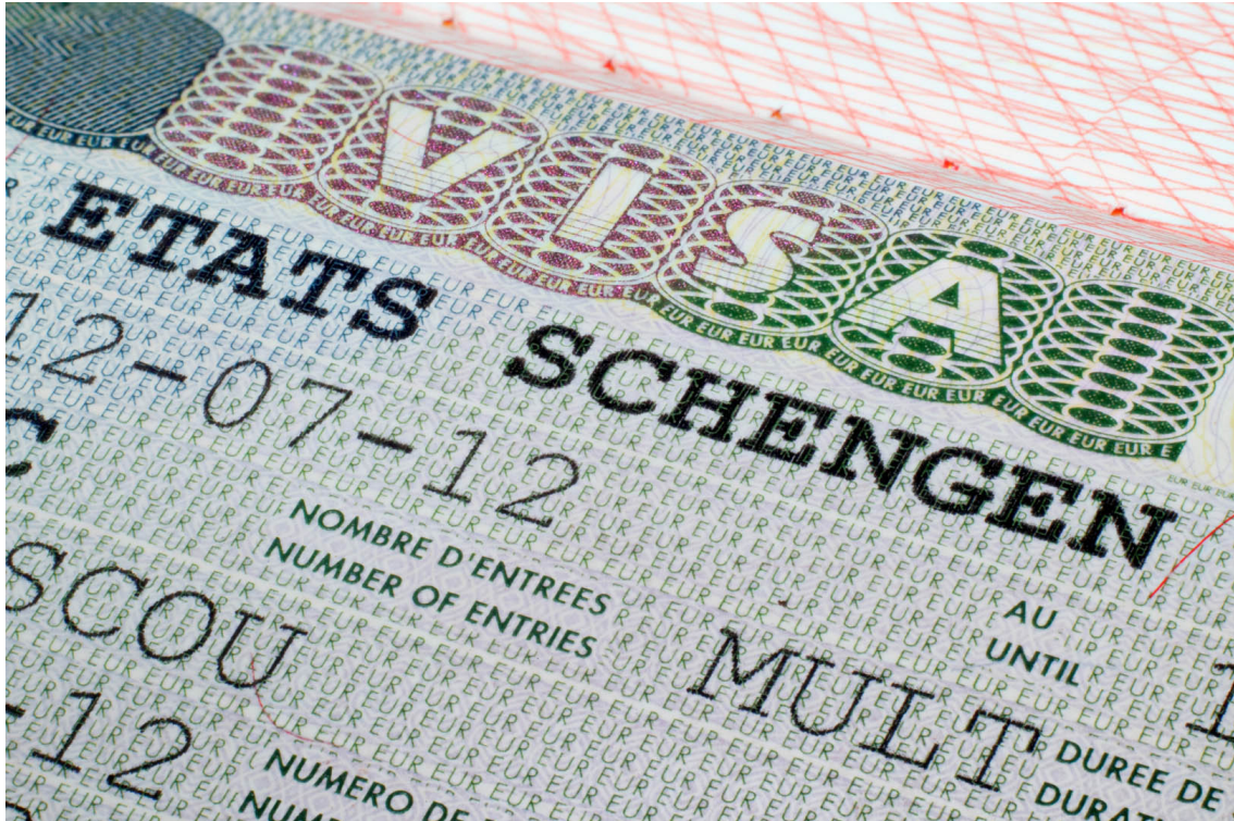
Schengeni ala on üks Euroopa Liidu alustalasid

1995. aastal loodi Schengeni infosüsteem , mis on kõige laialdasemalt kasutatav ja suurim julgeoleku- ja piirihaldusteabe jagamise süsteem Euroopas. 2023. aasta märtsis süsteemi tugevdati täiustatud teabevahetussüsteemidega ja uut tüüpi biomeetriliste andmetega. Samuti said teised ELi asutused, nagu Europol, sellele juurdepääsu.