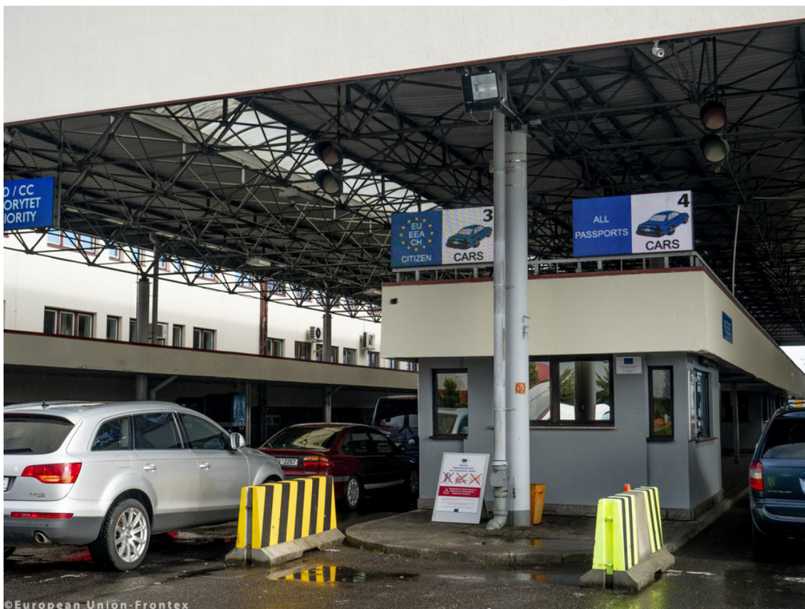
Autod piirikontrolli järjekorras

Euroopa Liidus passita reisimist võimaldav Schengeni ala on Euroopa integratsiooni üks selgematest saavutustest. Tutvume sellega lähemalt.