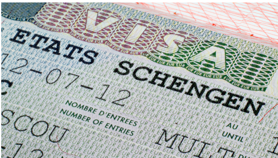
Visum för Schengenområdet.

EU:s passfria zon har stått inför utmaningar de senaste åren. Läs mer om frågorna och hur EU främjar fri rörlighet inom sina gränser.