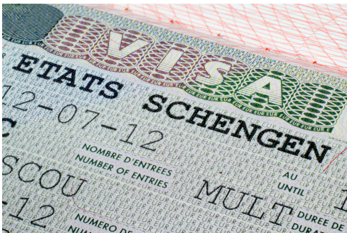
Šengeno erdvė susiduria su iššūkiais

Sužinokite daugiau apie problemas, su kuriomis susiduria laisvo judėjimo Šengeno erdvė, ir apie galimas jų pasekmes.