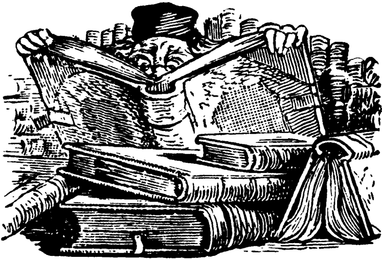
Bibliomaniac. Dessin de H.N. Cady, tiré de Lucille (1886).