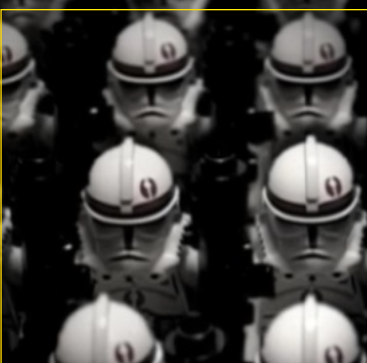
Triumph of the Empire

ist ein Propagandafilm im Auftrag der Imperialen Marine. Gezeigt werden Filmszenen, die während der Clone Wars gedreht wurden, gemacht um Hoffnung und Zuversicht der Untertanen des Imperiums zu stärken.