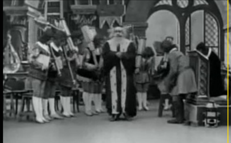
L'eclipse du soleil en pleine lune

Dies ist ein Film aus den Anfängen der bewegten Bilder. Ein Astronom und seine Schüler erleben gemeinsam eine Sonnenfinsternis. Ein Glück für die Popgruppe Queen, dass es Filme gibt, die Public Domain sind. Im Videoclip zu "Heaven for Everyone" wurden Stücke aus "Le voyage à travers l'impossible" und "Le voyage dans la lune" und eben "L'éclipse du soleil en pleine lune" verarbeitet.